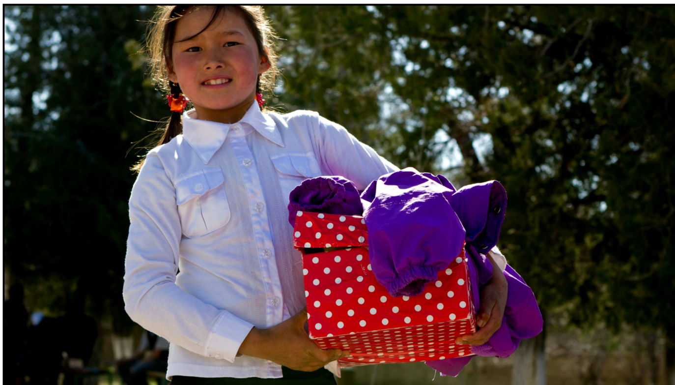
Genta í Kyrgyzstan við eini skógvaeskju frá Samaritan's Purse