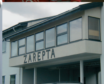
Myndir frá samkomulegum hjá Lívdini á Zarepta